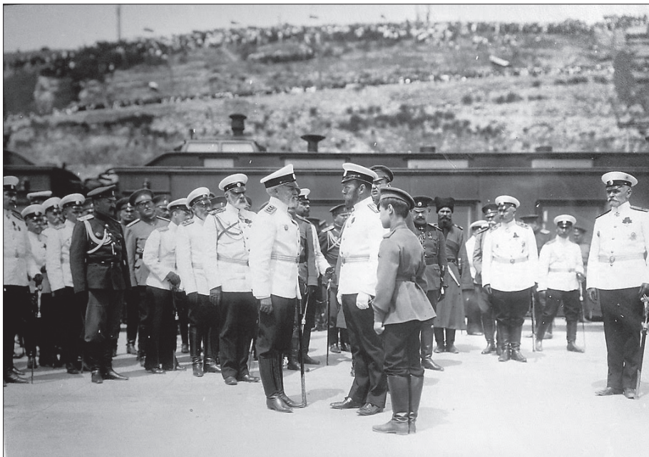
Император Николай II и Цесаревич Алексей в Ставке. 1914 г.

средних лет священник, казавшийся всегда весьма благочестивым и духовным, читал акт об отречении. Церковь была полна, все пришли наряженные и с оживленными лицами. Начиная со священника все торжествовали, радовались и приветствовали этот приговор России, поздравляя друг друга. Я же горько плакала. Прошел после этого один год. Встречаюсь я с этим батюшкой, и он мне говорит: “Знаете, когда я читал акт об отречении Государя, то увидев Вас плачущую, я поразился и подумал: “Вот странный человек, не только не отдается общей радости, а еще заливается слезами”. Теперь я понял Вас и как заплакал бы вместе с Вами”, – на что я ему ответила: “Эх батюшка, снявши голову, по волосам не плачут. Теперь Вы одумались, а прошел всего один год; увидите, как будете плакать дальше”» 3 .