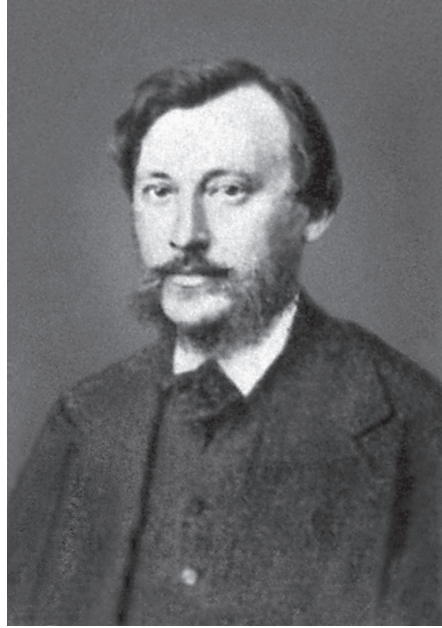
Константин Николаевич Леонтьев