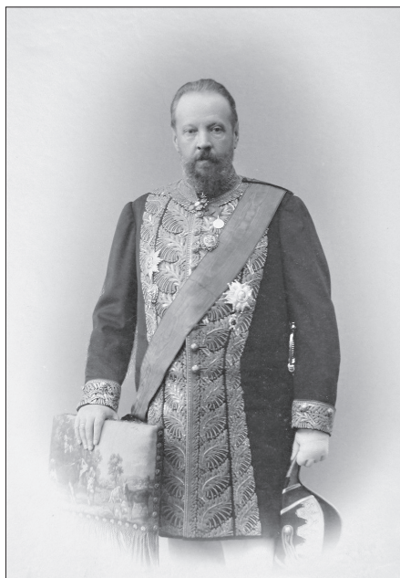
Граф С. Ю. Витте

Взлет карьеры молодого чиновника приходится на 1888 год, когда он стал лично известен императору Александру III. Сопровождая императорский поезд по Юго-Западным железным дорогам, Витте предупредил, что превышение скорости императорского поезда может привести к трагедии. Все это было высказано в свойственном Сер-