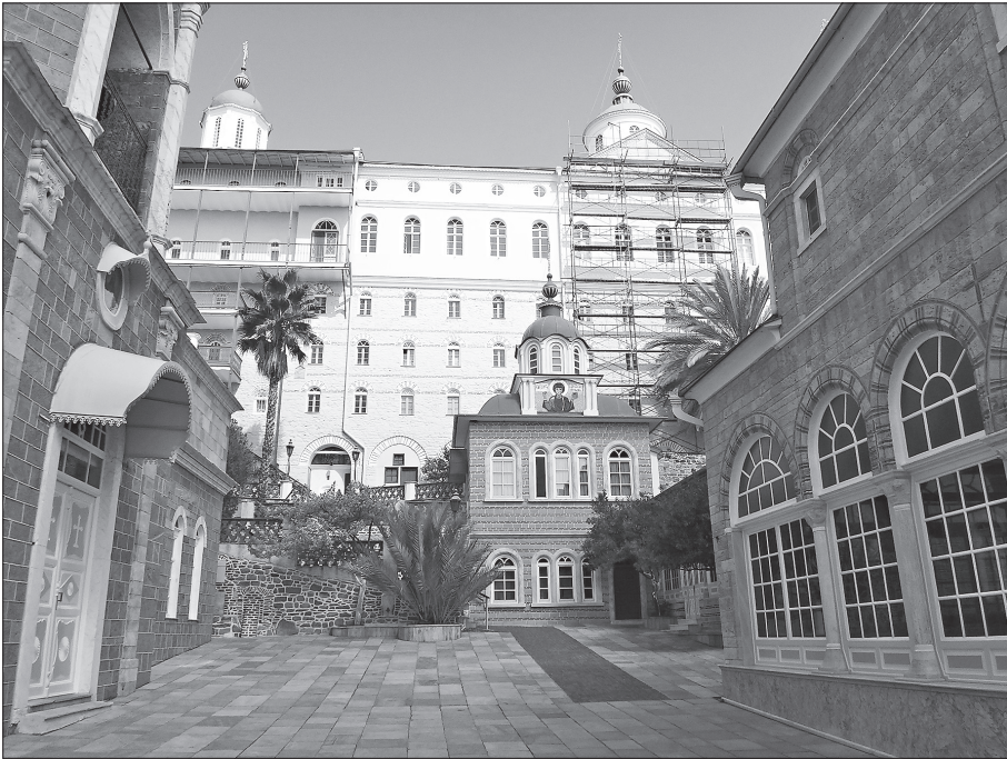
Двор Свято-Пантелеимонова монастыря

Ни в поведении, ни в лицах не углядываю благодатных токов святой земли. Разве что не слышно ни одного грязного слова. И то слава Богу. И еще во всем этом многолюдии нет ни одного женского лица. «Почему?» И в ответ за серебряной рябью времен «золотого руна» проступает царственная девичья фигура на берегу Афона. Направляется к воротам древнейшего монастыря Ватопед. Это год 422-й. «Остановись!» – Вскидывает гордую главу: кто осмелился возвысить голос на нее, Феодосию, дочь великого императора Плакиды? Оглядывается и видит вокруг склоненные головы монахов. Почудилось? Делает шаг, потом другой. И вновь слышит: «Остановись. Да не ступит нога женщины на монастырский порог!» Голос исходит от находящейся при входе иконы Божией Матери. Феодосия послушно отступает.