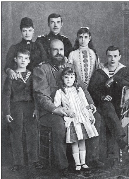
Император Александр III с семьей после железнодорожной катастрофы в Борках