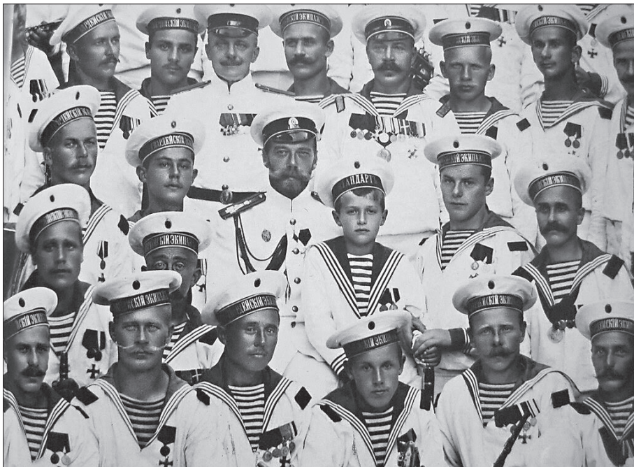
Царь и Цесаревич среди матросов «Штандарта». Фото 1910-х гг.

трению событий 1941 – 1945 гг. и их места в истории Отечества. Многие исследователи отмечают, что одним из важных факторов, обеспечивших выживание и победу Советского государства, являлись огромные людские ресурсы, позволившие компенсировать как потери начального периода войны, так и многие недостатки советской военной машины. Этот демографический потенциал появился не сам по себе, а в результате целенаправленной деятельности правительства Российской Империи в царствование Императора Николая II 25 . Не будет преувеличением сказать, что Великую Отечественную войну выиграли «дети» Николая II. На советские возрасты (до 26 лет) приходится 40 процентов потерь, а больше половины (60 процентов) – на поколения, рожденные и воспитанные в Российской Империи. Необходимо также учитывать, что значительная часть потерь молодежи приходится на 1941 г., когда была разгромлена кадровая Красная армия, основу личного состава которой составляли призывники 1920 – 1921 гг. рождения 26 .