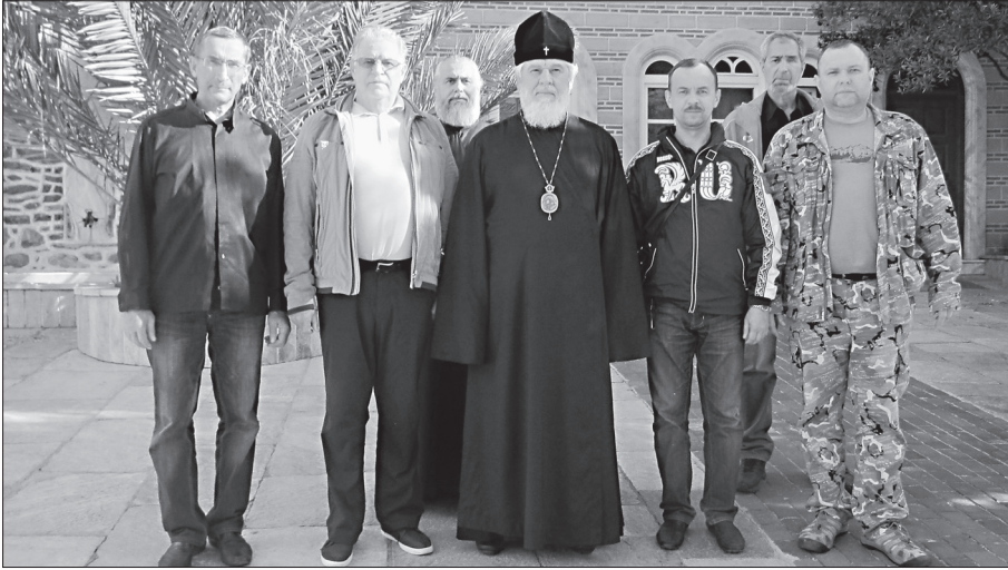
Самарские паломники с Владыкой Сергием в Свято-Пантелеимоновом монастыре

как каланча, с бородой в пояс монах рушится на колени, утыкается лбом в пол. Широоченное коромысло плеч под мантией сотрясается от рыданий.