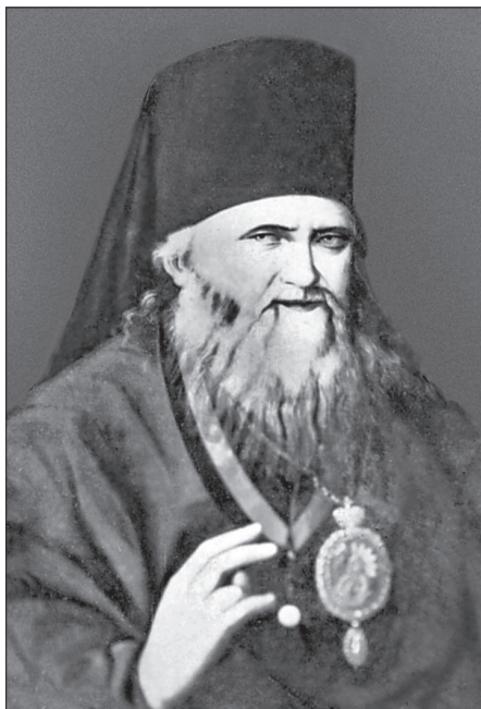
Епископ Петр (Екатериновский)

ОБ УТЕШЕНИЯХ ДУХОВНЫХ И О ТОМ, КАК ВЕСТИ СЕБЯ В СОСТОЯНИИ ДУХОВНОЙ СУХОСТИ