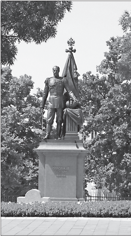
Памятник Николаю II в Белграде

нии долгих десятилетий безбожной власти, память святых Царственных страстотерпцев всячески пытались изгладить из сердец людей. Но эта память никогда не угасала. <...> Они являют перед нами образ высочайшего смирения, потому что 25 лет после великой славы, в которой они жили, они оказались в великом бесславии, и с терпением, и со смирением, подобно Христу, Который восходил на Голгофу, они восходили на свою Голгофу для того, чтобы здесь претерпеть смерть как страстотерпцы и мученики» 28 .