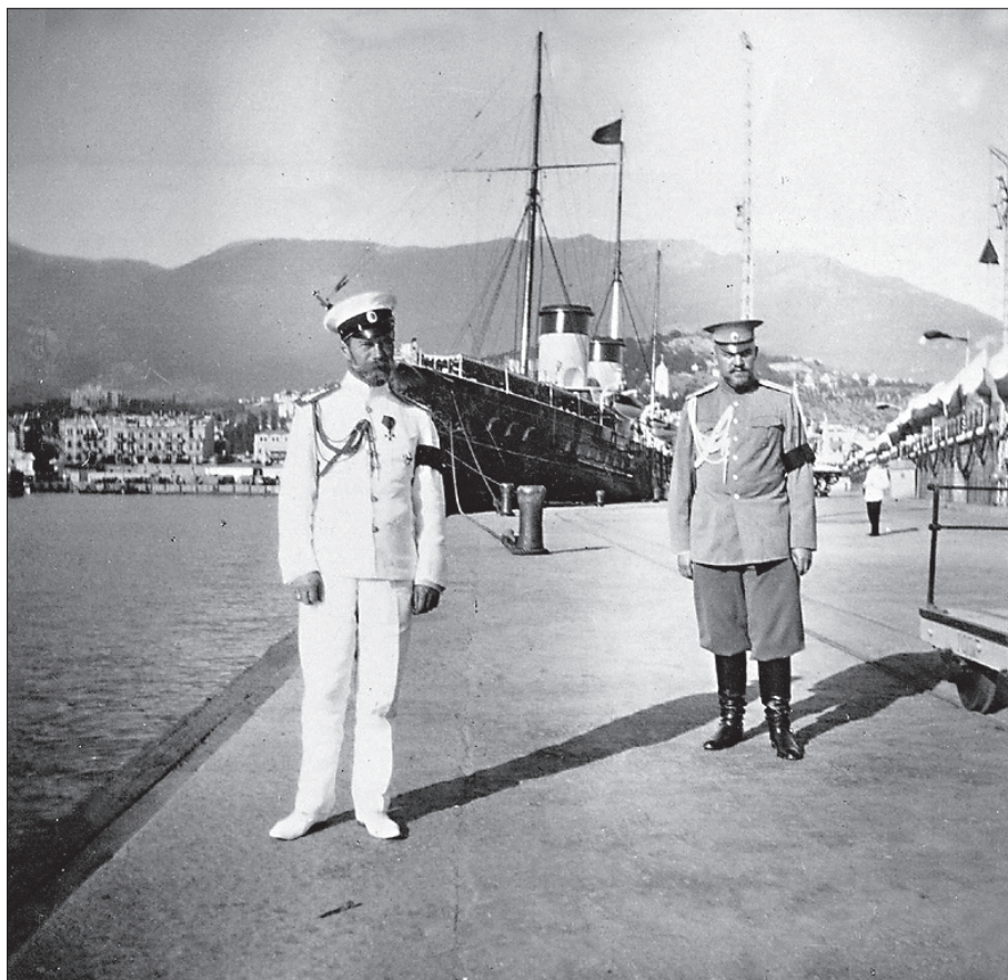
Император Николай II. Ялта. 1910-е гг.

«Не хочу здесь богословствовать о царской власти, скажу только, что это чувство, эта любовь родилась в душе моей внезапно, молниеносно, при встрече Государя в Ялте, кажется, в 1909 году. Когда я его увидел (единственный раз в жизни) на набережной, я почувствовал, что и Царь несет свою власть, как крест Христов, и что повиновение ему тоже может быть крестом Христовым во имя Его. В душе моей, как яркая звезда, загорелась идея священной царской власти, и при свете этой идеи по-новому загорелись и засверкали, как самоцветы, черты русской истории; там, где я раньше видел пустоту, ложь, азиатчину, загорелась божественная идея власти Божией милостью, а не народным произволением. Религиозная идея демократии была низвергнута во имя теократии в образе царской власти» [8, 143 – 144].