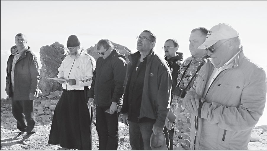
Молебен на Горе

ной надежде углядеть у подножия Горы среди камней отброшенные иссыхающие восемь главных страстей человеческих: чревоугодие, блуд, сребролюбие, гнев, печаль, уныние, тщеславие, гордость. Но, видно, рюкзак с вещами остался там, на Панагии, а страсти со мною – колющими репьями торчат в душе... Отсюда, с Афонской Горы, особенно явно видится, сколько трудов надо положить, какие искушения претерпеть на пути исполнения заповедей, преодолевая эти страсти.