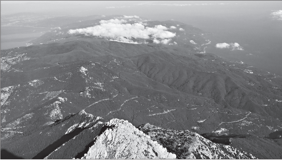
Афон с вершины

лы в море. Сквозь ультрамарин морской глади и синеву неба проступает румянец зари, как обещание нового дня. Сумеречный блеск моря, густеющая дымка у горизонта. Нет, слова бессильны, лучше фотокамера. Ловлю в «окошечко» море, дымку, горб протянувшегося утеса, человеческие фигурки у обрыва. Оттуда долетают голоса. Вдвоем с товарищем идем по «плавнику» утеса на голоса. Молодые ребята с таким же молодым священником вычитывают вечерние молитвы: «Достойно есть, яко воистину, блажити Тя Богородицу...»