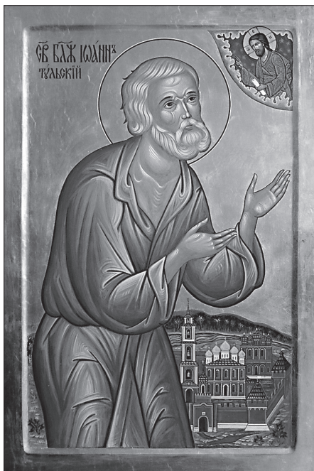
Святой блаженный Иоанн, Тульский Чудотворец. Икона