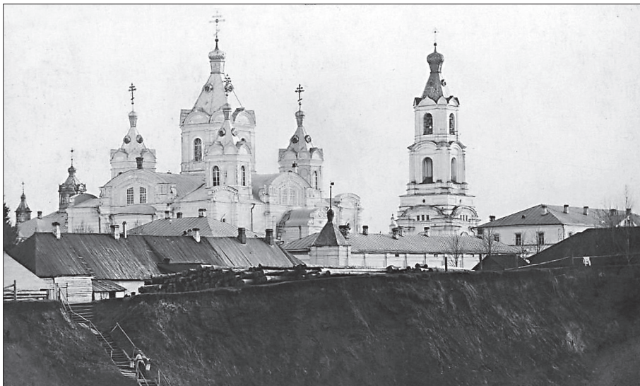
Бежецкий Благовещенский женский монастырь

ухаживала за ним, как за малым ребенком. Хоронили его с церковным звоном при большом стечении народа.