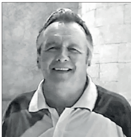
Александр Сергеевич Панарин

Почему Запад значительно более лоялен (если судить не по шумным заявлениям, а по делам) к коммунистическому Китаю, чем к «либеральной» России? Одной только ссылки на поднимающуюся мощь Китая, контрастирующую с деградацией России, здесь явно недостаточно. Дело в том, что либеральные «союзники» «демократической России», в первую очередь США и Германия, всеми силами способствуют этой деградации, спешно захватывая те позиции и прерогативы России, в отношении которых права