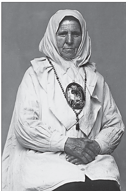
Петербургская блаженная Матронушка Босоножка