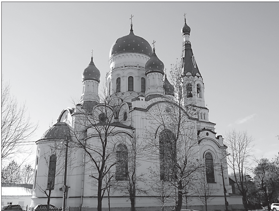
Покровский собор подворья Пятигорского Богородицкого монастыря (Санкт-Петербург, Ленинградская область, Гатчина, улица Красная, 3)