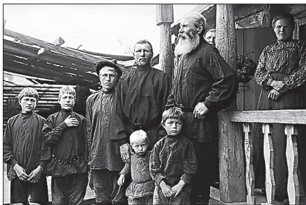
Русская семья в Екатеринбургской области. Фото конца XIX века

порядку. А как они дальше будут жить, когда своими семьями обзаведутся?