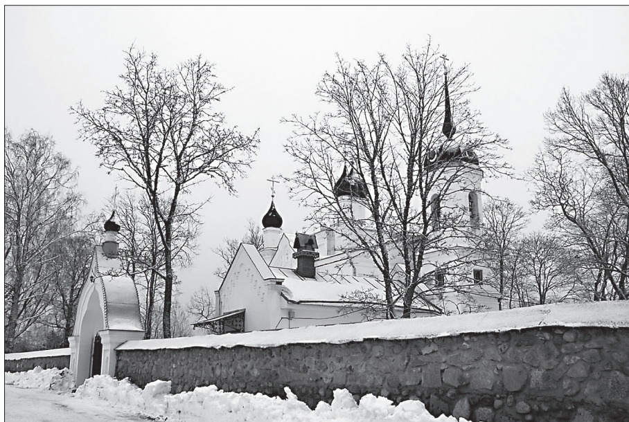
Творожковский Свято-Троицкий женский монастырь