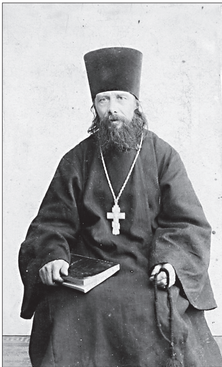
Преподобный Никон Оптинский