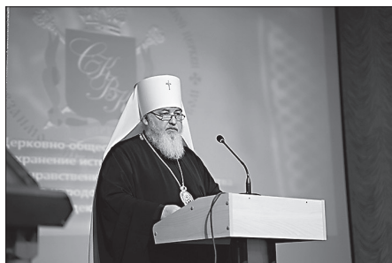
Председатель Синодального комитета РПЦ по взаимодействию с казачеством митрополит Ставропольский и Невинномысский Кирилл