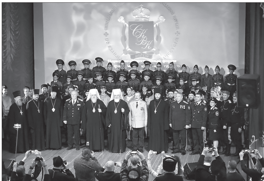
Участники церковно-государственного форума «Сохранение историко-культурного наследия казачества как фактор народосбережения в России». Самара