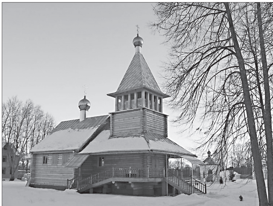
Никола-Одринский женский монастырь