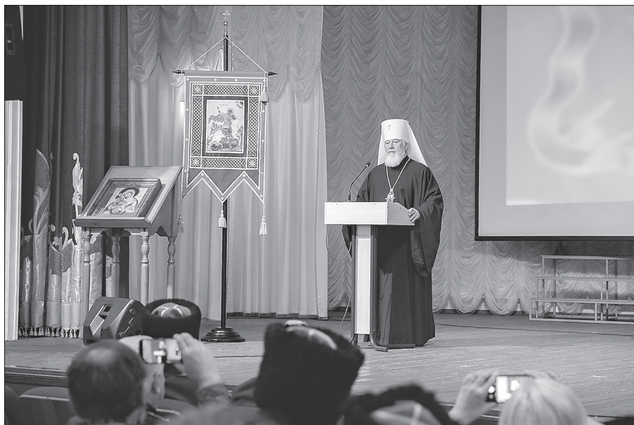
Приветственное слово участникам Форума митрополита Самарского и Новокуйбышевского Сергия